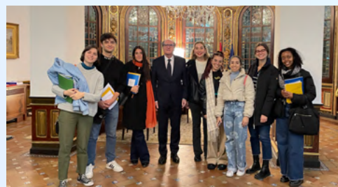
Visita al Defensor del Pueblo de España, estudiantes generación 2023/2024.

Este postgrado es un título propio que se adscribe a los programas de la Escuela de Formación Continua de la Universidad Carlos III de Madrid, que buscan facilitar la especialización del estudiante en un área concreta del conocimiento. La formación continua, formación permanente o formación a lo largo de la vida se hace cada vez más necesaria en la sociedad del conocimiento como factor básico para igualar las oportunidades, propiciar la cohesión social y generar calidad de vida en un mundo en constante cambio.